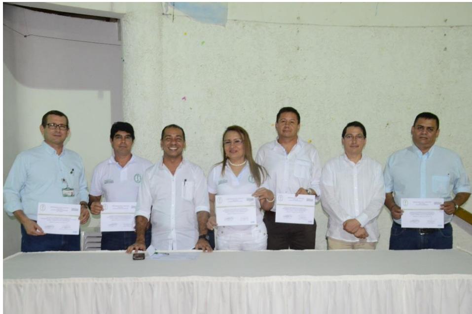
Decanos comprometidos con la Acreditación Institucional.