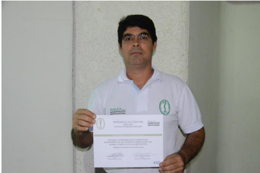
Docentes firmaron el "Acuerdo por la Acreditación".