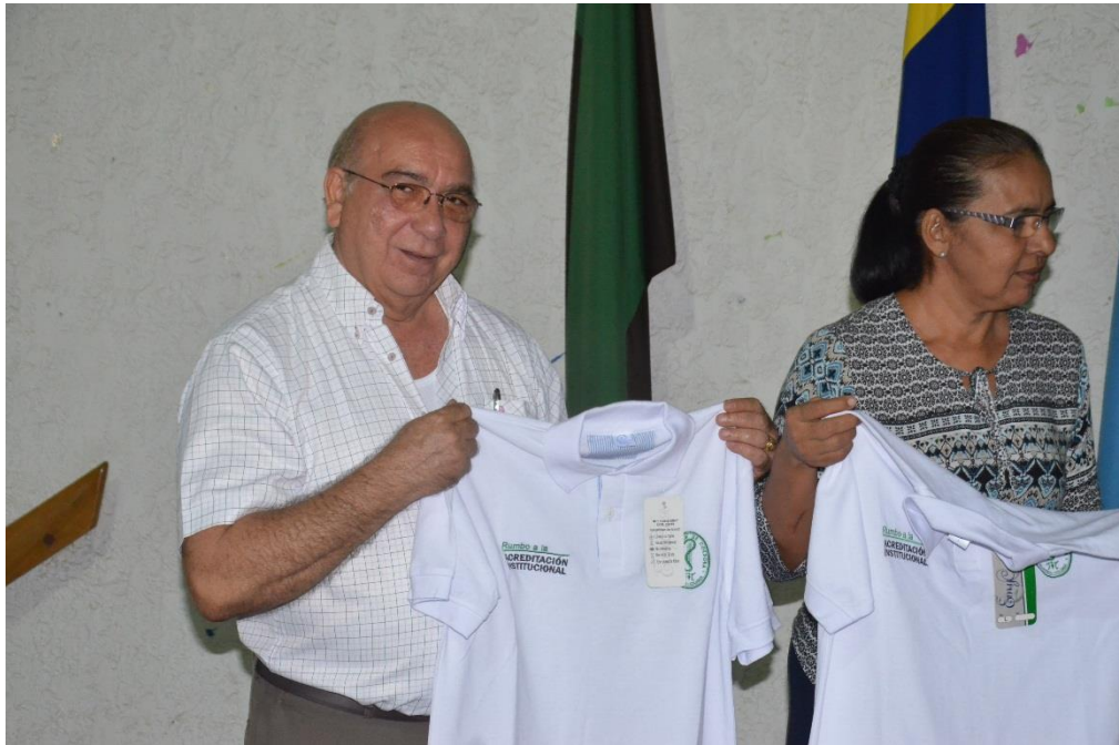
Entrega oficial de la camiseta de la Acreditación Institucional a los docentes la cual deben portar todos los jueves.